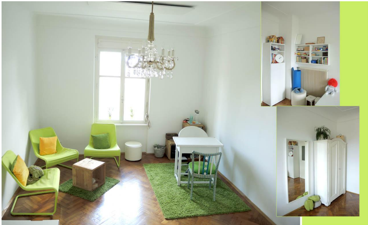
Praxis- und Beratungsraum „Kamille“ 22,3m 2

VITAMUS bietet insgesamt vier verschiedene Praxisräumlichkeiten an: