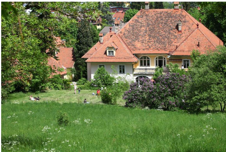
Villa mit 13.600m 2 Gartenanlage