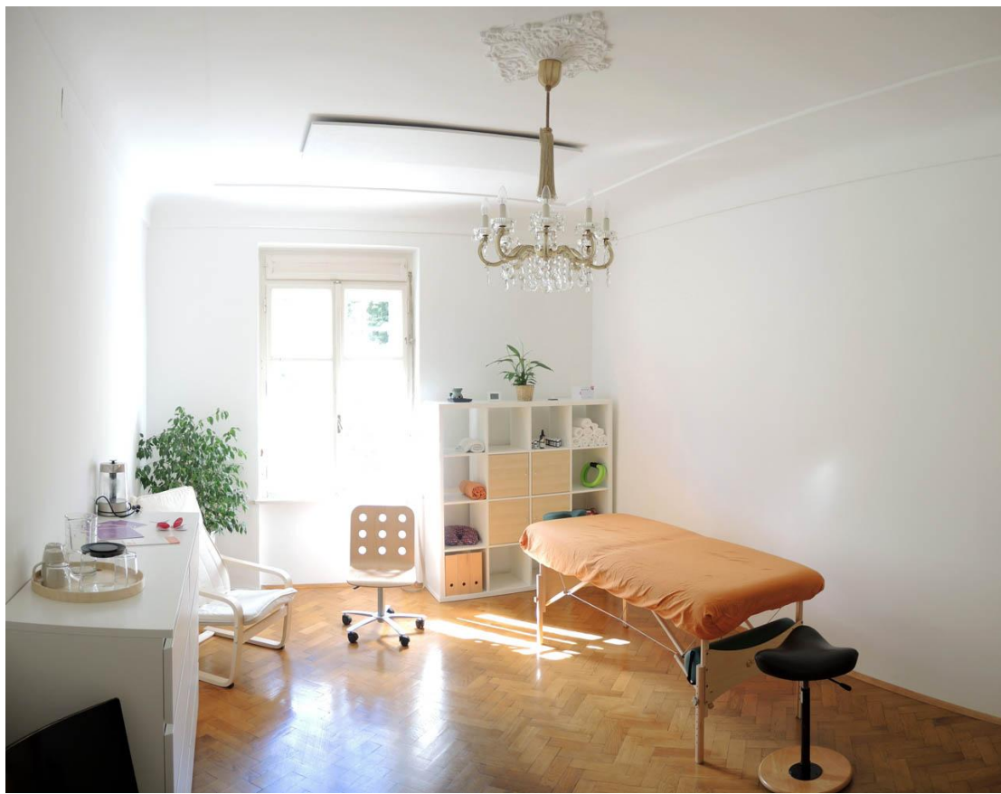
Praxis- und Beratungsraum „Melisse“ 21,1m 2