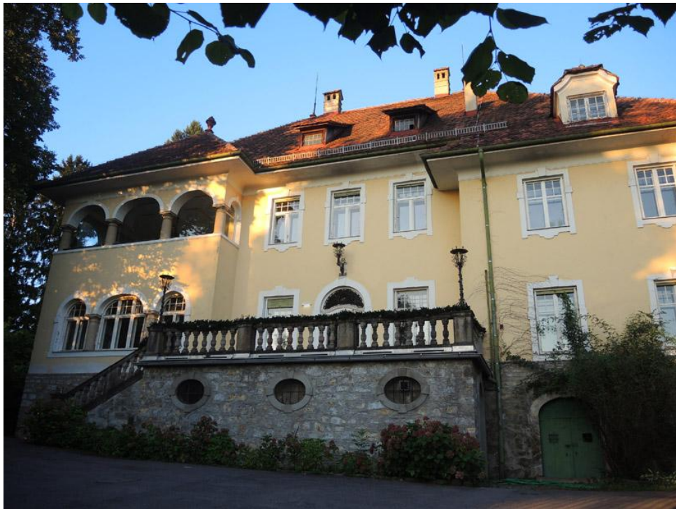
Villa erbaut im späten 19. Jahrhundert

Edle Villenräumlichkeiten umgeben von einer 13.600m 2 großen Gartenanlage mit traumhafter Kulisse.